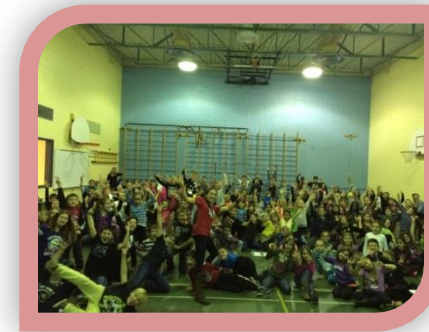
Rencontre avec l'athlète olympique Kathy Tremblay