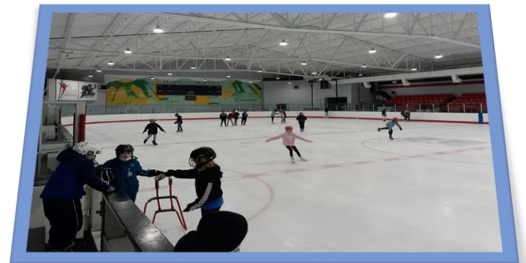
Sortie à l'aréna