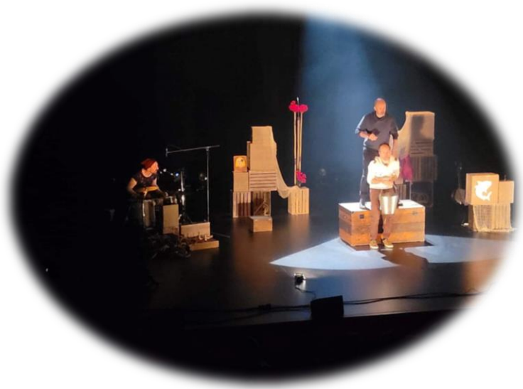
Sortie culturelle au théâtre