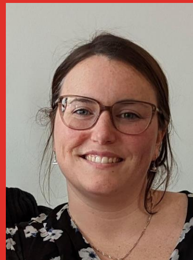
Présidente du conseil d'établissement depuis l'année scolaire 21-22