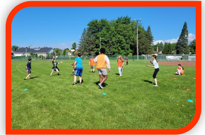
Partie d'ultimate Frisbee