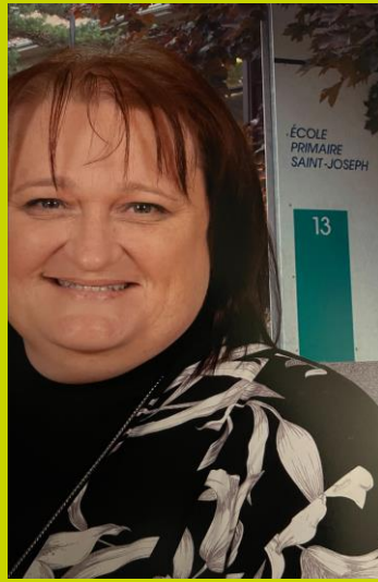
« Capitaine » de l'école St-Joseph depuis juillet 2019.